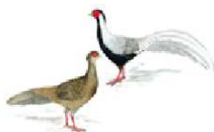
Silberfasan [ Lophura n. nycthemera ] .