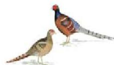
Burma-Humefasan [ Calophasis humiae burmanicu ] .