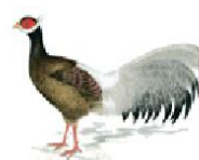
Brauner Ohrfasan [ Crossoptilon mantchuricum ] .