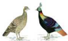
Gelbschwänziger Glanzfasan [ Lophophorus impejanus ] .