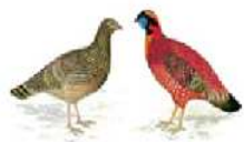
Temminck Tragopan [ Tragopan temminckii ] .