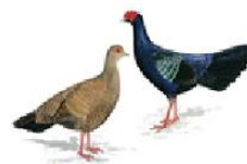
Edwards-Fasan [ Lophura edwardsi ] .