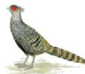
Wallichfasan [ Catreus wallichii ] .